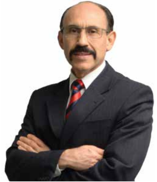
Vice Presidente y Director del Ministerio Multicultural de la Unión del Sudoeste

Hagamos nuestras las palabras de Josué 24:15, "Y si mal os parece servir a Jehová, escogeos hoy a quien sirváis, ... pero yo y mi casa serviremos a Jehová".