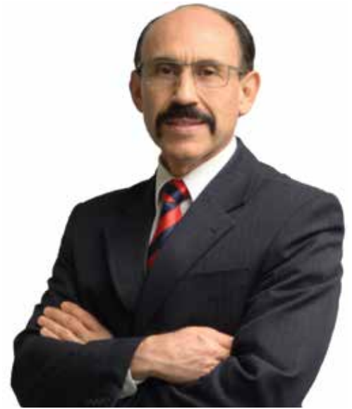
Vice Presidente y Director del Ministerio Multicultural de la Unión del Sudoeste

¡Que Dios te bendiga en tu anhelo de alcanzar esa salud integral!