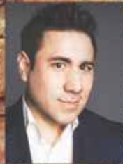
Hugo Yin Cantante