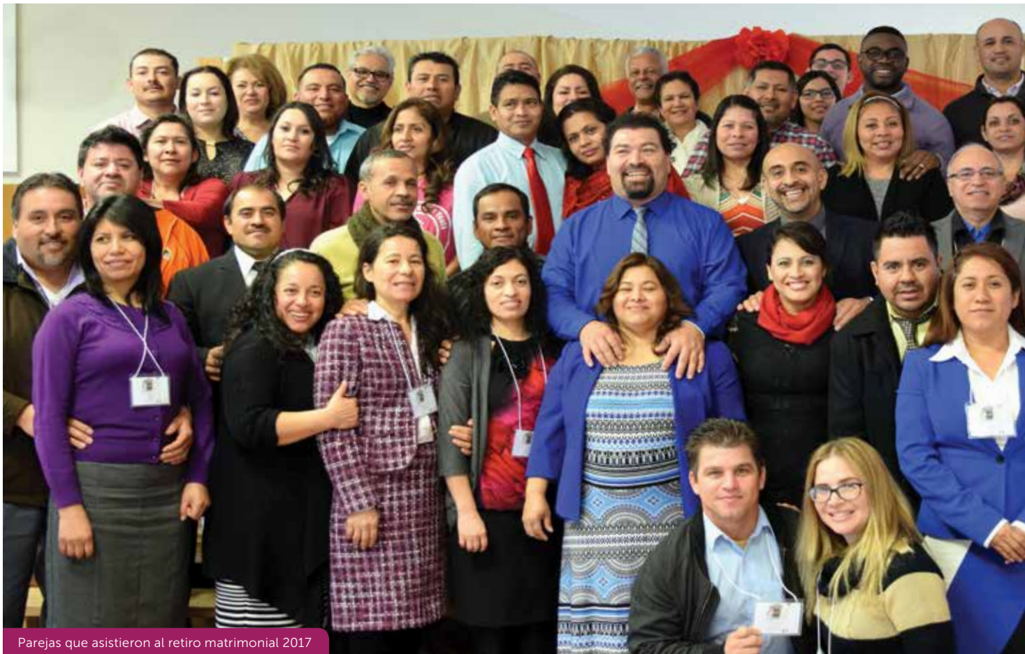
Parejas que asistieron al retiro matrimonial 2017

Una de las parejas presentes nos cuenta su testimonio de como este seminario matrimonial impactó sus vidas, tanto personales, como espirituales y, en su relación de pareja. Los nombres de la pareja han sido omitidos por privacidad.